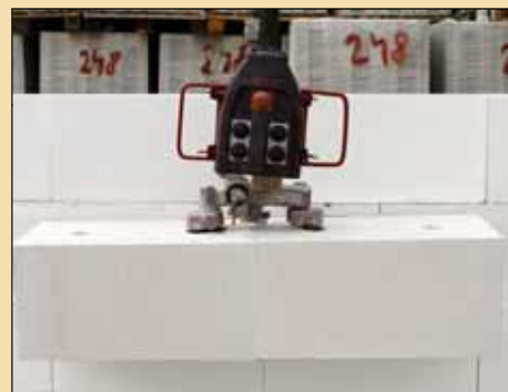
2x SENDWIX 16DF