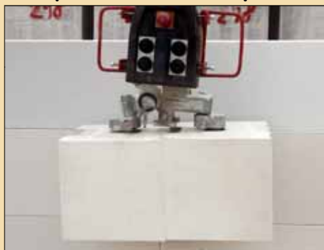
2x SENDWIX 8DF (4DF)