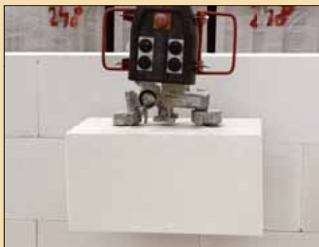
1x SENDWIX 16DF