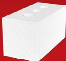
SENDWIX 2DF-LD 240x115x123