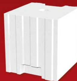
SENDWIX 8DF-LD 248x240x248