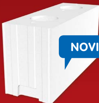
SENDWIX 12DF-LD 498x175x248