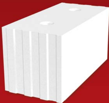
SENDWIX 16DF-LD 498x240x248