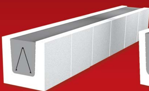
SENDWIX PŘEKLAD 8DF 240x240x1000-3000