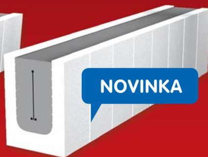
SENDWIX PŘEKLAD 6DF 175x240x1000-3000