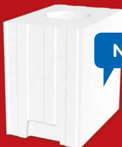
SENDWIX 6DF-LD 248x175x248