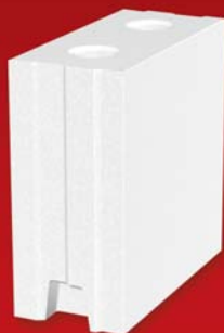
SENDWIX 4DF-LD 248x115x248