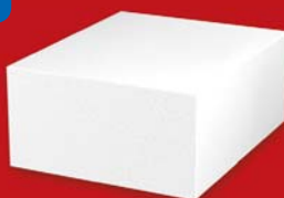
SENDWIX 5DF-LP 290x240x123