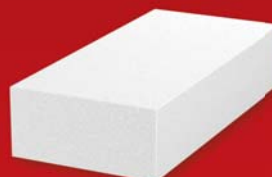
Lícová cihla VF 290x140x65